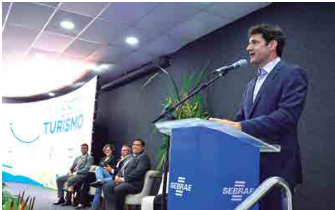
Ministro Marcelo Álvaro abriu o 3º Seminário Itinerante do Programa Investe Turismo no auditório do Sebrae, na capital