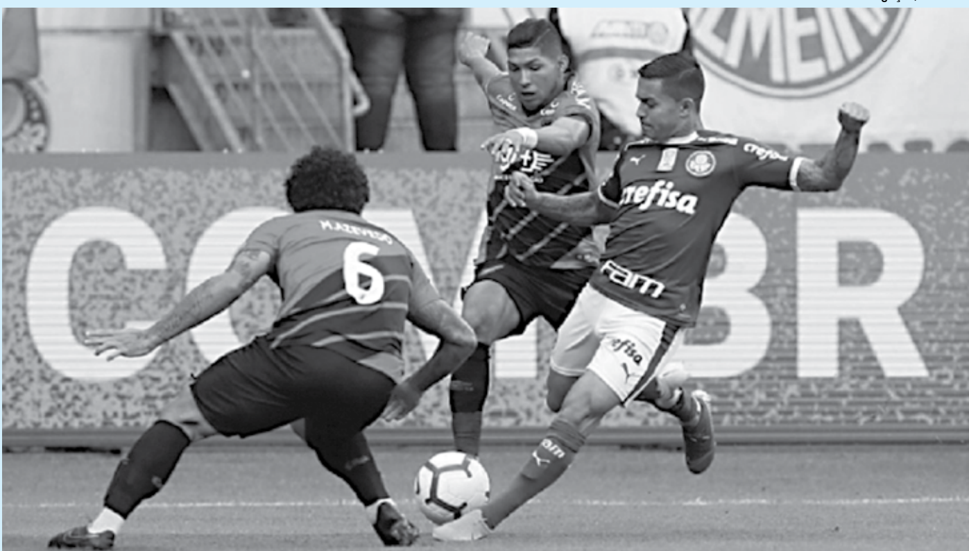
No último sábado, o Palmeiras mostrou a superioridade no Campeonato Brasileiro e venceu, mesmo com dificuldades, o Athletico-PR, por 1 a 0

Agora a equipe entra de férias e só deve voltar a competir profissionalmente no segundo semestre de 2020, quando devem ocorrer as disputas da Série B do estadual. Em 2019, o time ainda buscará competir no Paraibano Sub-19 previsto para ser iniciado em julho, além da equipe feminina que vem sendo trabalhada para disputar também o campeonato local que garante vaga para o Brasileiro Série A2.