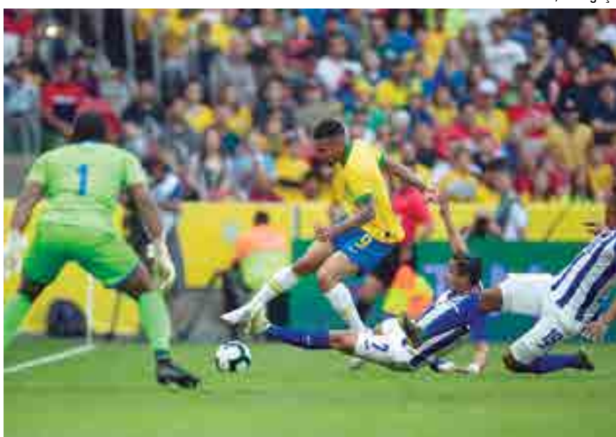
Gabriel Jesus marcou dois gols contra Honduras e chegou aos 16 gols na era Tite da seleção

paração da Seleção Brasileira antes da Copa América Brasil 2019 serviu para dar confiança ao grupo. A goleada por 7 a 0 sobre Honduras mostrou que o