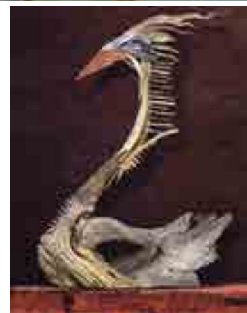
Mostra 'Da natureza' está no hall de exposições da Energisa Paraíba

artista deve explorar técnicas pertinentes ao material que utiliza, além de pesquisar o mercado que acolhe o tipo de obra escolhida. São atitudes que ele toma para garantir a fluidez do seu trabalho. Ex-sobrinho de A União, onde atuou como designer gráfico