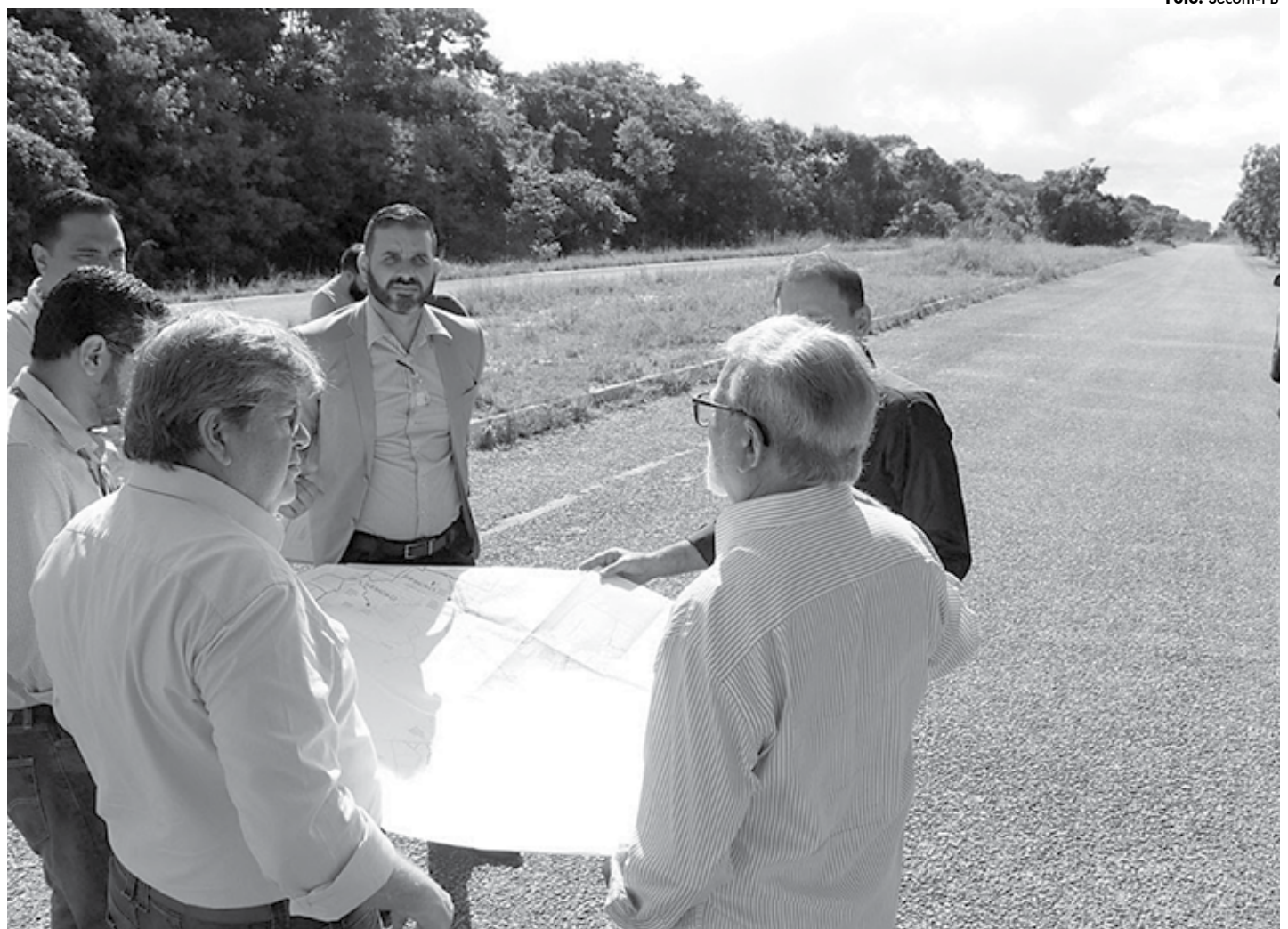
O governador João Azevêdo apresenta hoje o projeto do Polo Turístico Cabo Branco a empresários da área interessados em investir no complexo

O governador ainda garantiu que a área do Polo Turístico Cabo Branco é dotada de toda