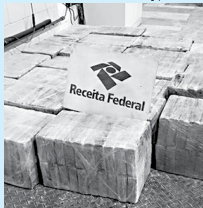
A droga tinha como destino o porto de Roterdã, na Holanda