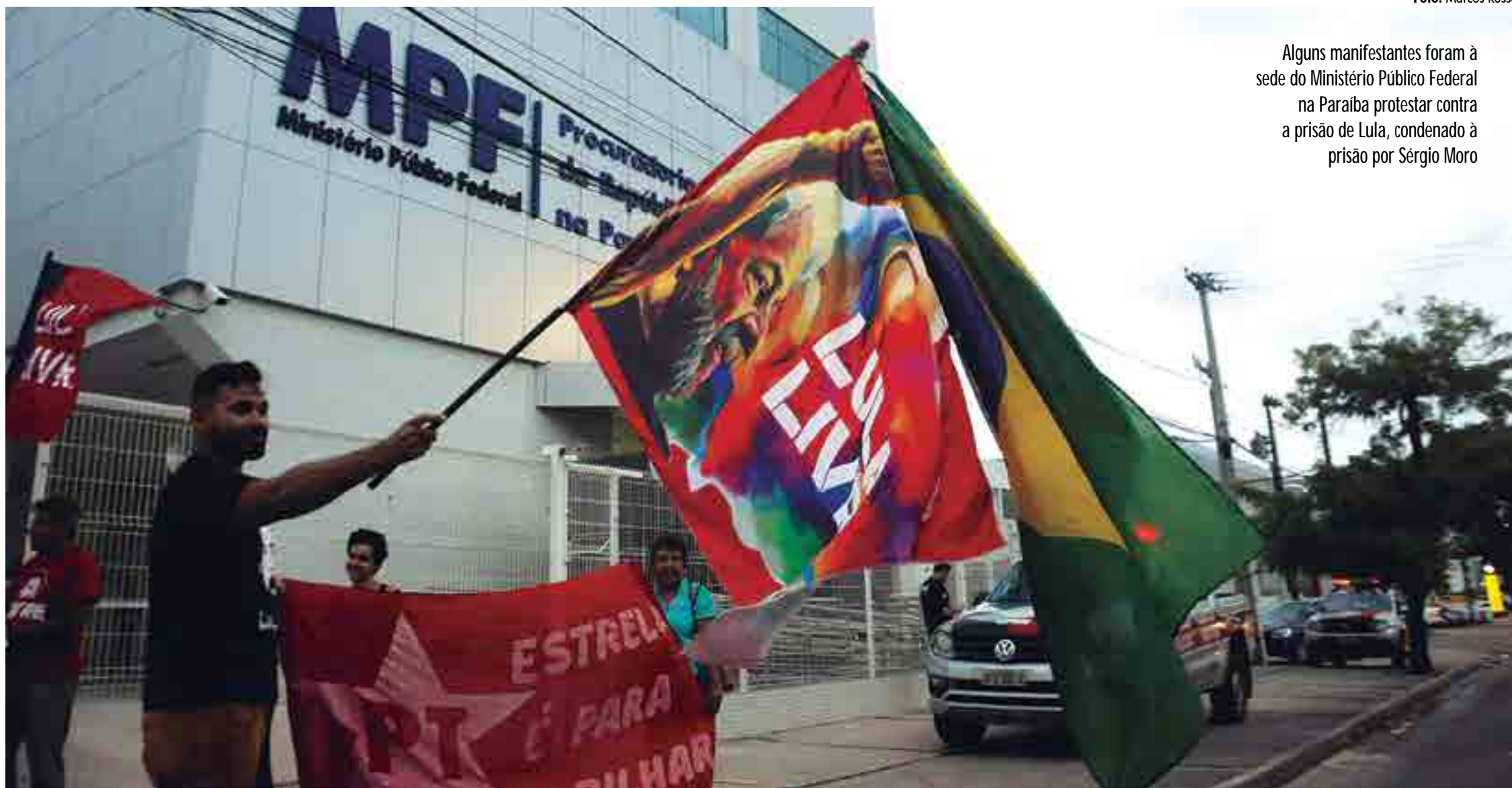
Alguns manifestantes foram à sede do Ministério Público Federal na Paraíba protestar contra a prisão de Lula, condenado à prisão por Sérgio Moro