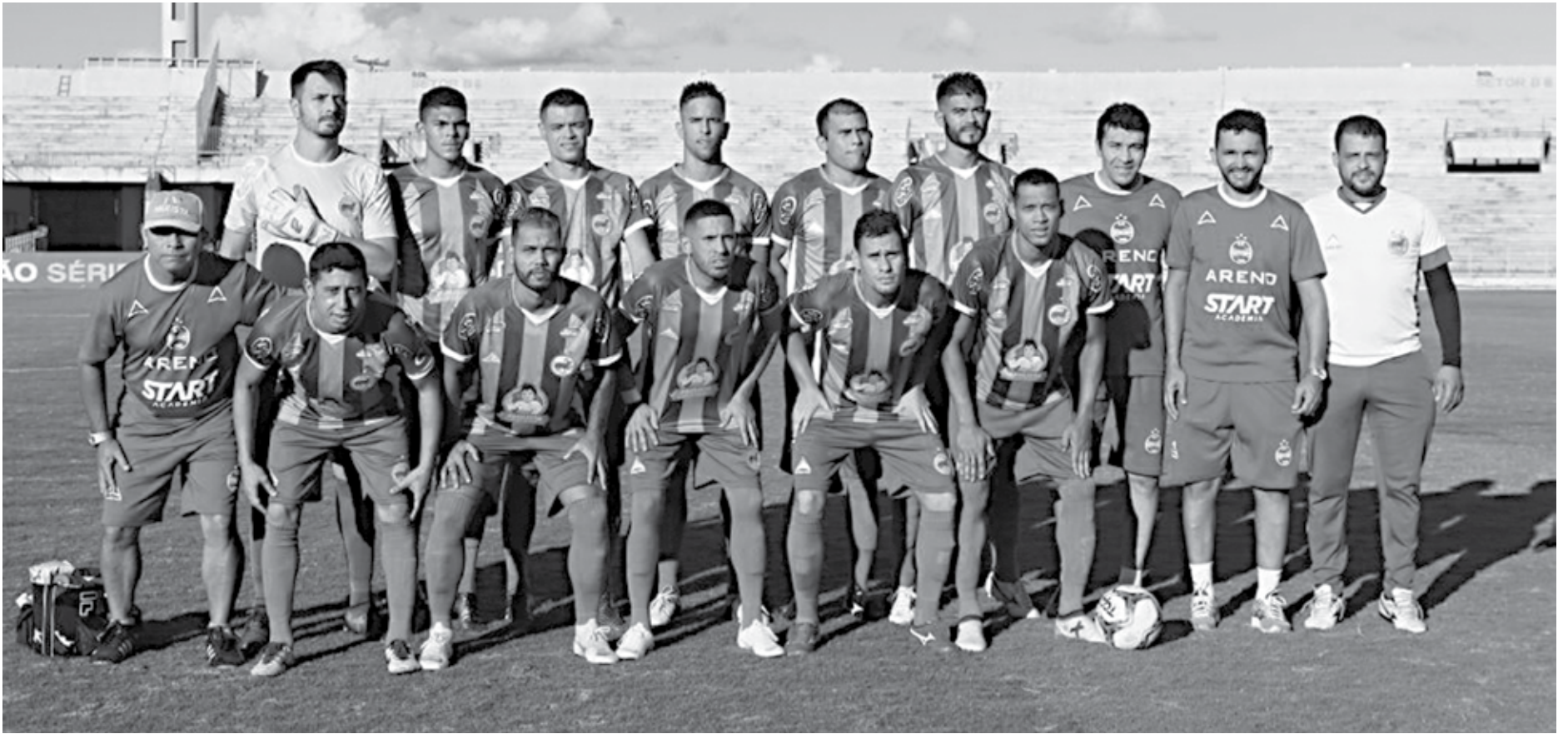
Com este elenco, o Grêmio Recreativo Serrano, de Campina Grande, conseguiu ser o pior time do Campeonato Brasileiro da Série D de 2019 com seis derrotas, 28 gols sofridos e apenas dois marcados

Para fechar os recordes ao inverso, o time verde e branco da Serra da Borborema ainda foi goleado, na última rodada, por 8 a 0 pelo América-RN. Com o resultado, a equipe empatou com o Náutico-RR - que perdeu para o Atlético-AC pelo mesmo placar em 2016 - no posto de segunda maior goleada sofrida em todas as edições da Série D. A maior goleada da quarta divisão foi aplicada