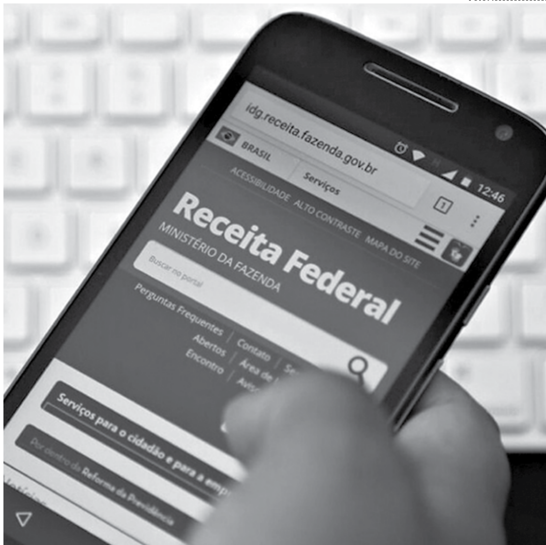
A Receita Federal já está disponibilizando a consulta à restituição do Imposto de Renda; valor estará na conta dia 17